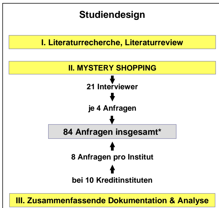
Abbildung 1: Studiendesign

* 2 Datensätze sind bei der Auswertung nicht berücksichtigt worden