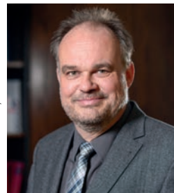
Lukas Siebenkotten Vorsitzender des Verwaltungsrats des vzbv und Präsident des Deutschen Mieterbundes (DMB) @lsiebenkotten