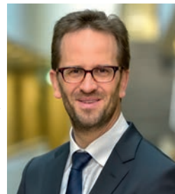
Klaus Müller Vorstand des Verbraucherzentrale Bundesverbands (vzbv) @Klaus_Mueller