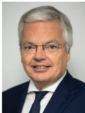
Didier Reynders EU-Kommissar für Verbraucherschutz (per Videobotschaft) @dreynders