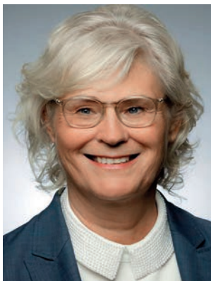
Christine Lambrecht, MdB Bundesministerin der Justiz und für Verbraucherschutz