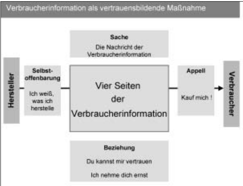
Abbildung 3: Verbraucherinformation als vertrauensbildende Maßnahme

In der Regel konzentriert sich die wissenschaftliche und gesellschaftspolitische Diskussion ausschließlich auf diese Sachaussage der Verbraucherinformation. Die üblichen Fragen lauten: Ist ihre Nachricht richtig und wichtig, ist sie verständlich oder irreführend, wie aktuell ist die Nachricht und von wem wird sie wie häufig genutzt. Das Modell der „Vier Seiten der Verbraucherinformation“ erweitert den Diskussionsrahmen. Es zeigt, dass jede Verbraucherinformation auch eine Art „Selbstoffenbarung“ enthält. Der Hersteller signalisiert beispielsweise, dass er tatsächlich weiß, was er herstellt.